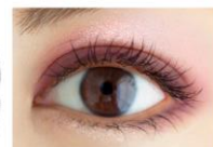
02 オーロラモーヴ 星屑の光を秘めた 甘すぎない 色っぽモーヴ