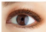
01 クリスタルベージュ ピュアなきらめきを まとった美人オーラを 放つベージュ